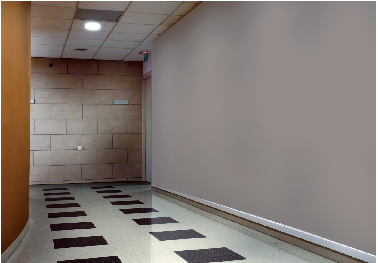
Salud: pasillo de centro asistencial