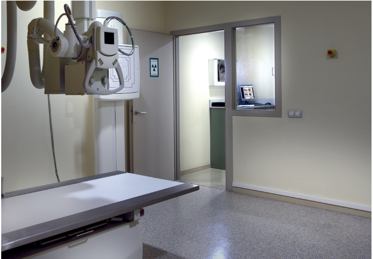
Salud: sala de radiografías