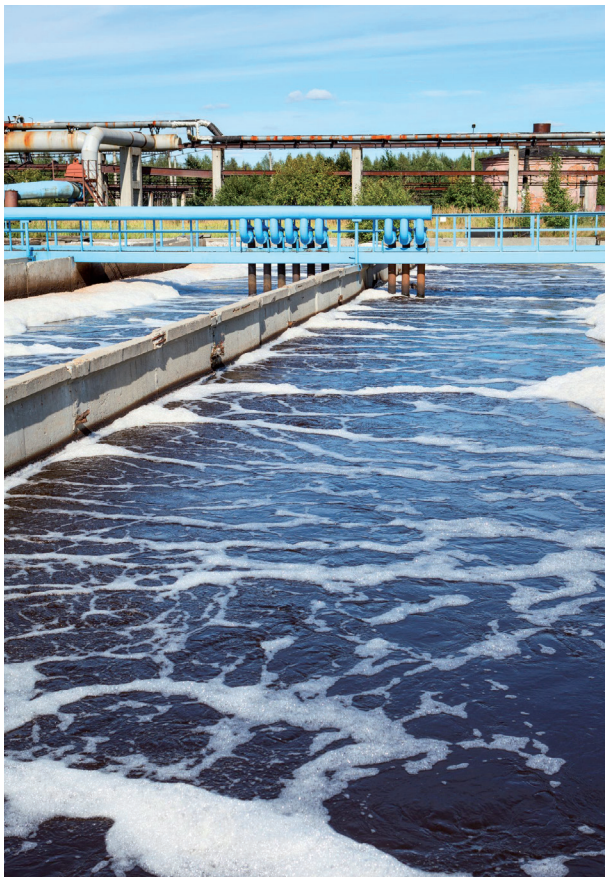
Tratamiento de aguas: EDAR